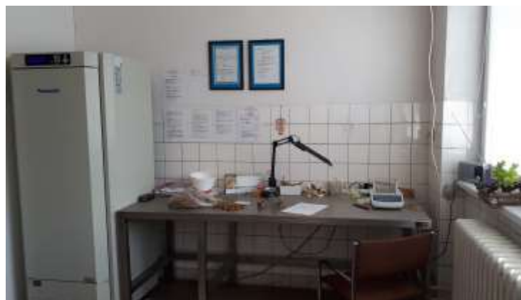
Lesné semenárstvo, škôlkarstvo a umelá obnova lesa 2019 Liptovský Ján 19.6. – 20. 6. 2019